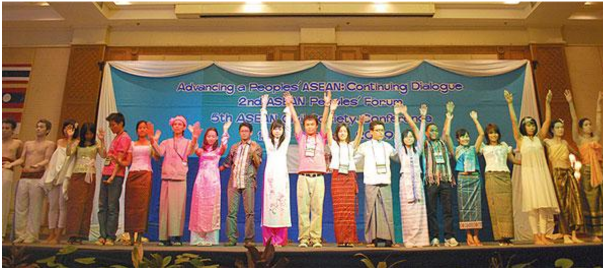
Last year's youth forum in Cha-am, Thailand.

For these reasons, they demand the Asean governments to formulate policies to support comprehensive sexuality education and enhance programmes to guarantee young people access to health care without any discrimination. They should also increase the quality and coverage of health systems and health care services, including sexual and reproductive health, as well as safe and legal abortion. They also urge youth organisations to forge partnerships with Asean governments and other non-governmental organisations in advocating for these improvements.