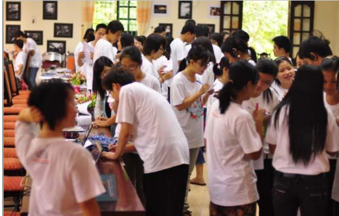
Đại biểu các nước tham gia trao đổi tại Diễn đàn

Theo dự kiến, trong vòng 3 ngày của diễn đàn, các thành viên sẽ được tìm hiểu sâu hơn về ASEAN: cơ cấu tổ chức, hoạt động, các cơ chế hợp tác; về các hoạt động của thanh niên ASEAN. Các bạn trẻ cũng sẽ được thảo luận về các vấn đề quan tâm của Thanh niên ASEAN, đưa ra các khuyến nghị, giải pháp nhằm hướng tới các chương trình hành động thực tế, hiệu quả; đồng thời chuẩn bị các kiến nghị của thanh niên ASEAN sẽ trình bày trong Diễn đàn Nhân dân ASEAN.