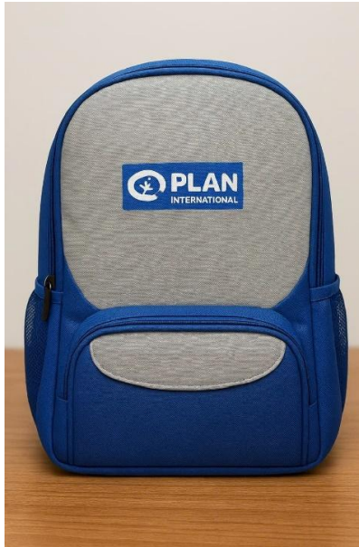
Hình ảnh Balo mẫu