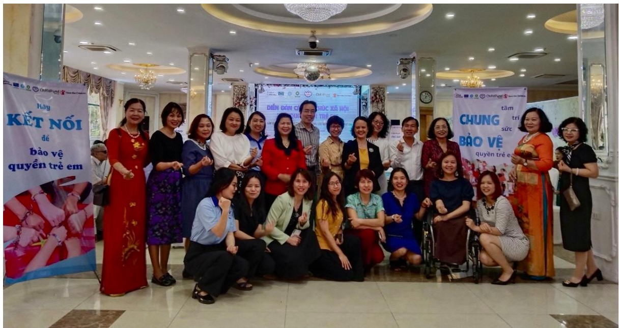
ảnh tại Diễn đàn các tổ chức xã hội về bảo vệ quyền trẻ em