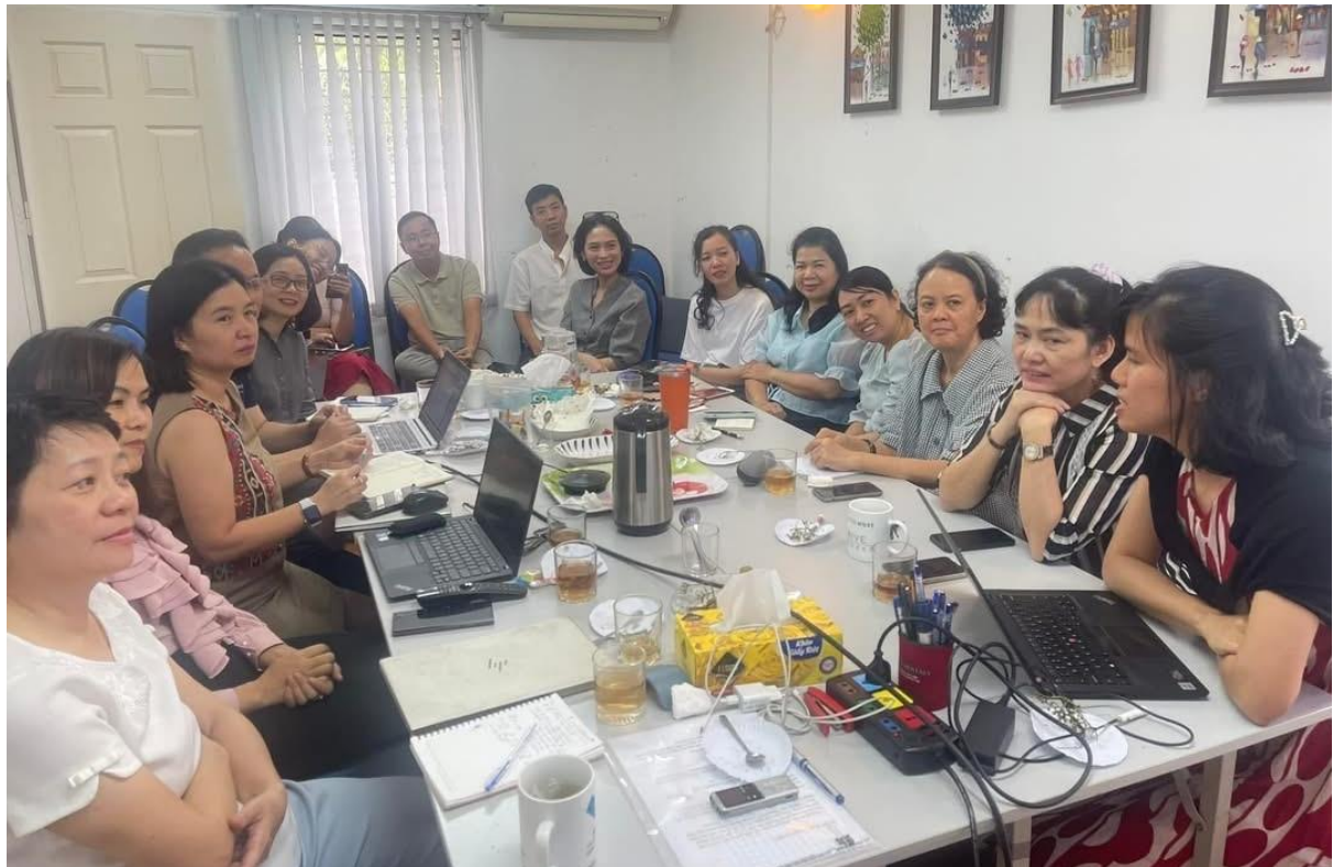
Hình ảnh cuộc họp nhóm thường kỳ tại VP trung tâm NGO RC