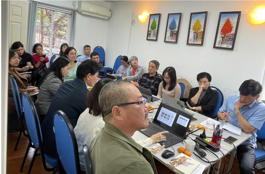
Họp thường ký tại văn phòng Trung tâm NGORC