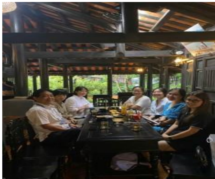
Họp nhóm thường kỳ