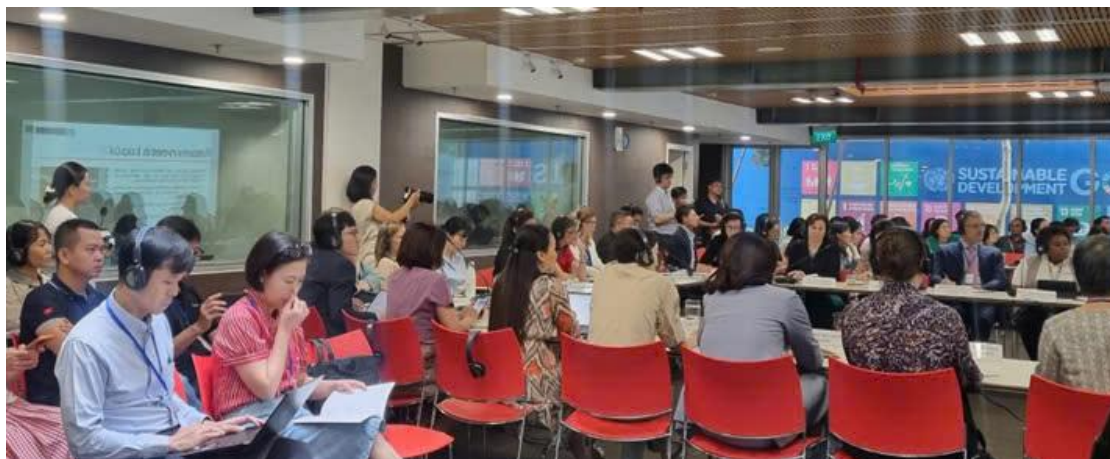
Họp khẩn cấp giữa MARD, các TCPCPNN và các bên liên quan về cơn bão Yagi